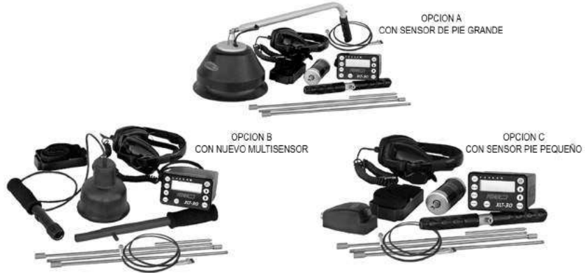
OPCION A CON SENSOR DE PIE GRANDE