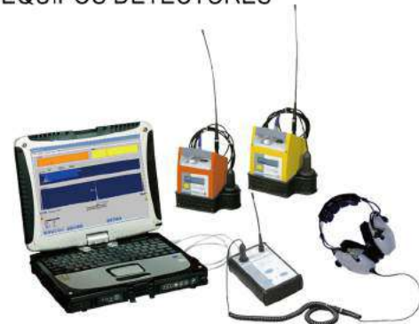
HL6000X™ -- PC CORRELATOR