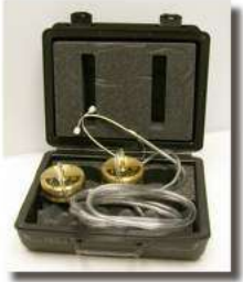
GEOFONO MECANICO HEATH CONSULTANTS