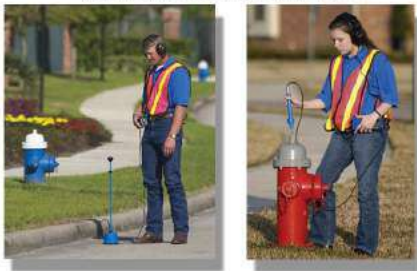
GEOFONO ANALOGO HEATH CONSULTANTS